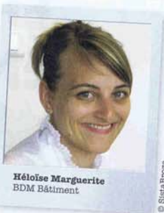
Héloïse Marguerite BDM Bâtiment

En matière de rénovation le réflexe des professionnels consiste toujours à bâtir des enveloppes isolantes à base de polystyrène, matériau d'origine fossile et à forte énergie grise mais peu cher et présentant un bon rendement énergétique. Des alternatives durables existent pourtant,