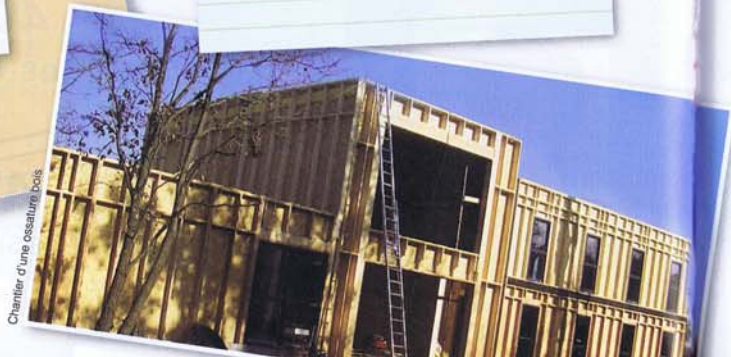
Chantier d'une ossature bois